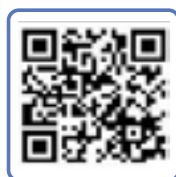
鲜文大学 韩国语 教育院 网上报名 QR码

开学前取消注册时, 除入学管理费以外的学费(学费) 全额退款, 开学后自动退学时, 按照学费退款规定进行退款。